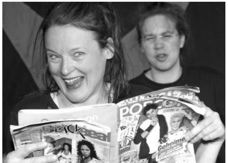
Schauspieler aus `Forget Madonna`