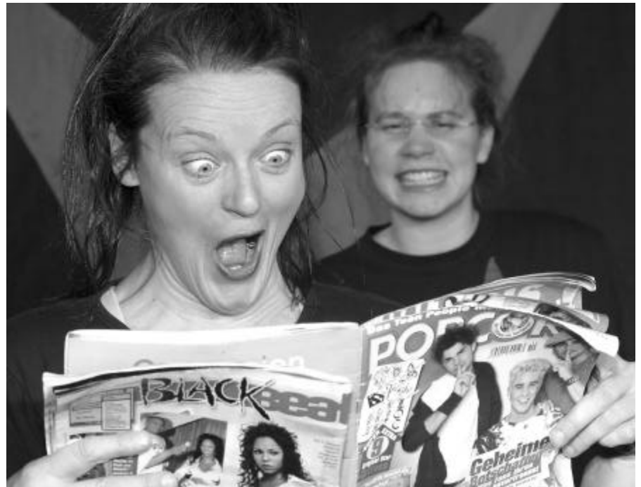
Schauspielerinnen in dem Theaterstück 'Forget Madonna'