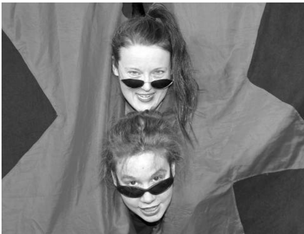
Die Schauspielerinnen als Susi und Sonja

Ich muss los, hab´ noch ein Date, Goethe muss leider warten. Tschüs ( ab ) So: ( zu Publikum ) Ich musste dann am besagten Samstag noch dringend etwas für Deutsch vorbereiten, so dass ich der Einladung leider nicht nachkommen konnte. Aber am Übernächsten war es dann soweit, ich bin tatsächlich hingegangen.