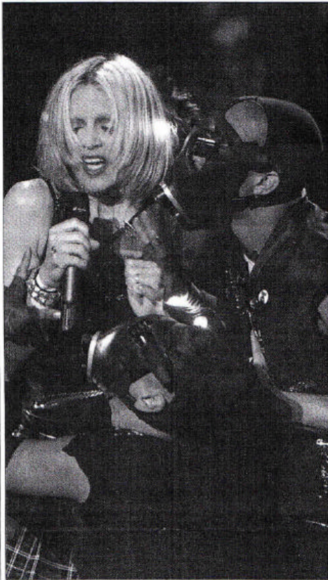
DER DUFT STARKER FRAUEN hat schon manchen umgehauen. Lady Madonna und ihre Tänzer bei der Berliner Show.

Es ist 20 Uhr, Konzertbeginn, und die Bühne leuchtet bis 20.07 Uhr in Blau. Von 20.07 Uhr leuchtet sie, um es genau zu sagen, bis 20.30 Uhr mal in Rot, mal in Orange, auch mal in Lila. Um 20.31 Uhr dann kommt endlich Nebel, das Licht geht aus und wieder an und jetzt fahren die Musikrichtungen aus, Hunderte von Monitoren leuchten curacaofarben auf, und sie, Madonna, fährt wie eine Statue bewegungslos herein. Schwarzes enges Top, blond, ohne Hut, Lederhose, ich glaube, sehr schmal in den Hüften, darüber roter Rock, sieht aus wie von Burberry (keine Ahnung, welche Phase das jetzt insgesamt ist??). Madonna lässt sich nach 20 Sekunden von einer Hydraulik in die Höhe fahren, und singt, wie schon beim Auftakt der Welttournee in Barcelona, „Drowned World - Substitute for Love“. Schönes Lied. Unter ihr springen zehn Tänzer in Schwarz herein, hechten über die Bühne, während sich Madonna von der Hydraulik wieder runterfahren lässt. Jetzt kriechen die Tänzer aus irgendwelchen schwarzen Stoffhüllen und greifen Madonna an, aber Madonna wehrt sich und schlägt und beißt die Tänzer, ähnlich vermutlich wie Max Schmeling, so dass